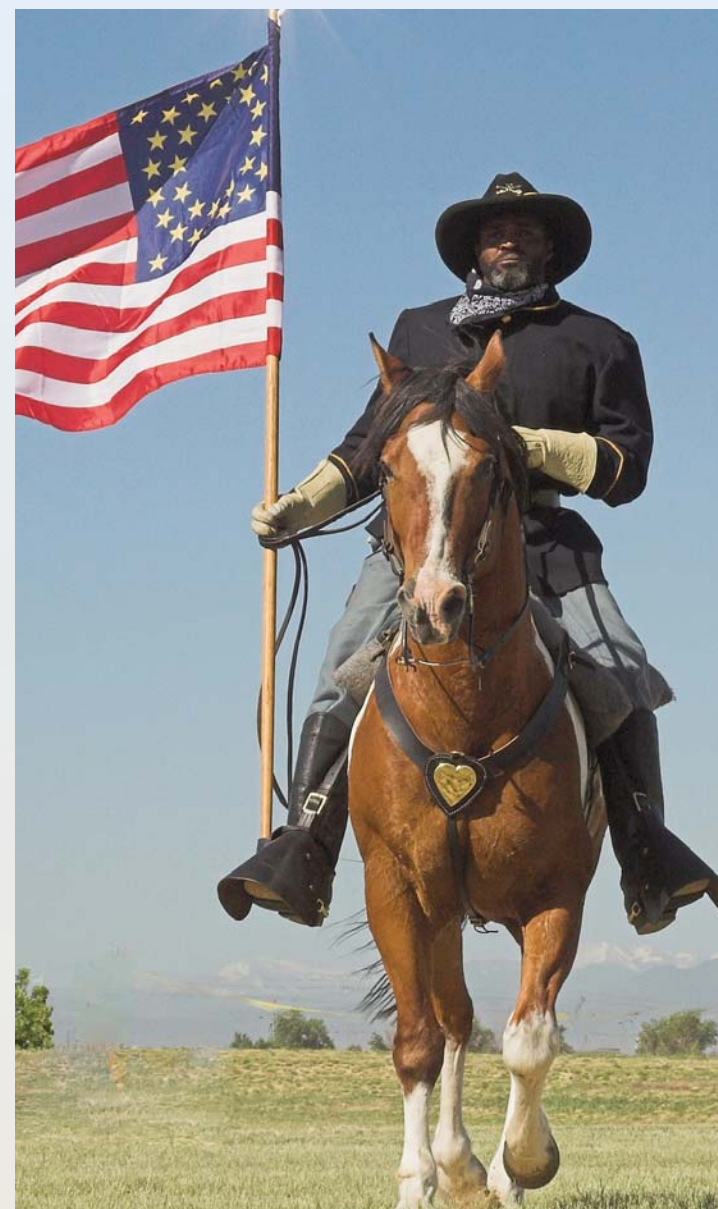
El “Refuge Roundup 2008” (Rodeo 2008 del Refugio)

Además de las presentaciones, el “Refuge Roundup 2008” ofrecerá una histórica representación de los “Soldados Búfalos” del oeste americano, presentaciones en vivo de raptos por el club de halconería de Colorado (“Colorado Hawking Club”), y una prueba de la vida de los pioneros en las planicies cortesía de la Sociedad Histórica de Colorado (Colorado Historical Society) y el Centro de Conservación de las Planicies (Plains Conservation Center). Vaqueros de “An Open Range Experience” (Una Experiencia de la Pradera Abierta), enseñarán a los visitantes a convertirse en “vaqueros por un dia” dando lecciones de lazo y rodeo.